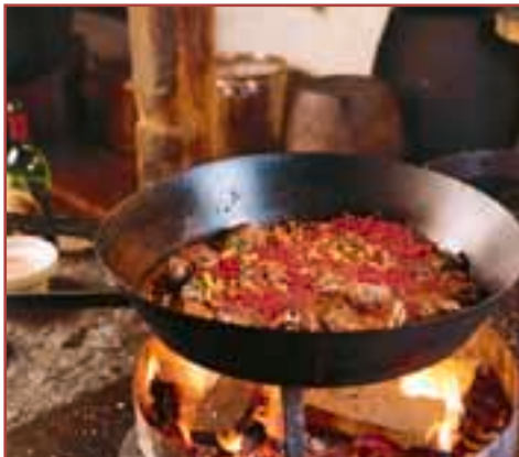
Über offenem Erlenholzfeuer brutzeln Rehnüsschen mit Pfifferlingen und Preiselbeeren in der antiken Schmiedepfanne.