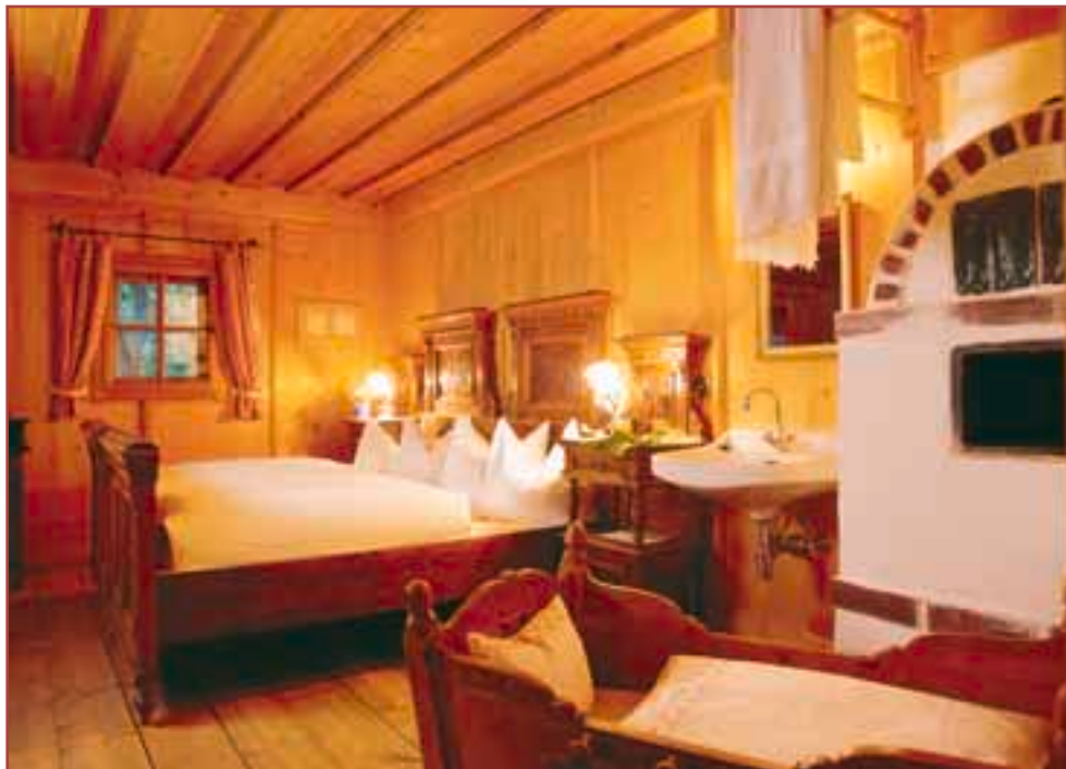
Pinzgauer Bauernromantik vermitteln die zauberhaften Zimmer mit ihrem antiken Mobiliar.